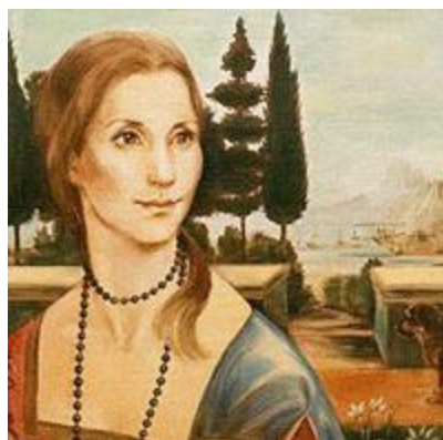
METAMORFÓZY PETR KOLÍNSKÝ (RŮZNÉ TECHNIKY)

ÚVODNÍ SLOVO ZDENĚK POŠÍVAL PIANO GIORA KUKUI