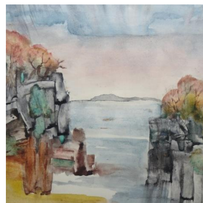
KRAJINY TOMÁŠ PAČES (AKVARELY)